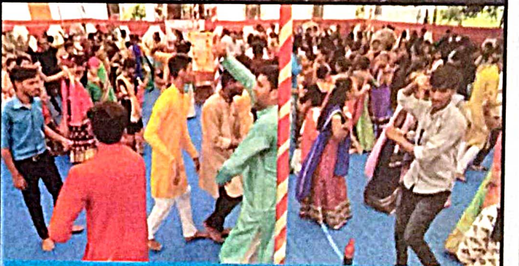
તા. ૯-૧૦-૨૦૧૯ ના રોજ કોલેજના શરદોત્સવ મહોત્સવમાં મસ્ત બની ગરબે ઝુમતા કોલેજના વિદ્યાર્થીઓ