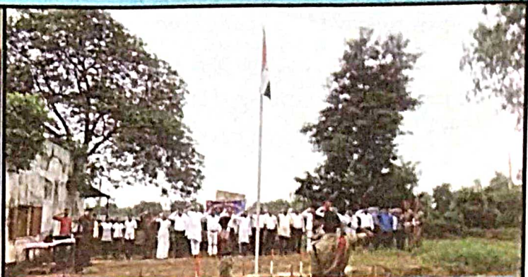
તા. ૧૫-૮-૨૦૧૯ ના રોજ પેટલાદ એજ્યુકેશન ટ્રસ્ટ સંચાલિત બી.એડ, ડોમર્સ તથા આર્ટસ એન્ડ સાયન્સ ગ્રુપે કોલેજના આચાર્યશ્રી તેમજ N.C.C. માં ભાગ લીધેલ તમામ વિદ્યાર્થીઓ અને કોલેજ પરિવાર